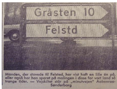
Manden, der stavede til Felsted, har vist haft en lille én på, eller også har han sparet på malingen i disse far vort land så trange tider. — Vejskiltet står på „minutvejen“ Aabenraa-Sønderborg

Begraves fredag kl. 14 fra Felsted kirke.