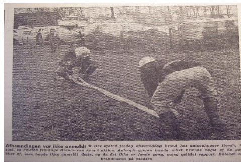
Afbændingen var ikke anmeldt. * Der opstod fredag eftermiddag brand hos autoophugger Hønsb, på 8000. De frivillige Brandværene kom i aktion. Autoophuggeren havde intet brande møde af de gamle biler af, men havde ikke anmeldt det, og da det ikke er første gang, kunne politiet rapport. Billedet viser brandmand på pladsen